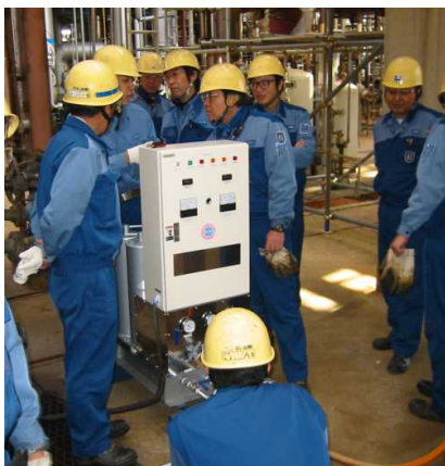
ミラクルボーイ SRC-814-15V型 防爆仕様