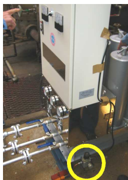
← 計装用空気をパージ 防爆対策のひとつとして、微量の 圧縮空気で盤内を正圧に保ちます。 ↓ 空気流量調整器

「オイルメーカー殿へオイル濾過装置が納入される」と いう珍事(?) からか、たくさんのご出席をいただきました。